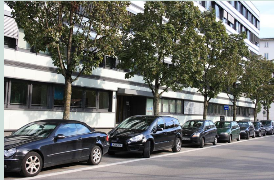
Bilder Außenansicht Pilgersheimer Straße 20